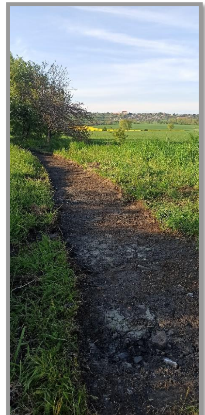
Cesta k nádraží v průběhu prací.